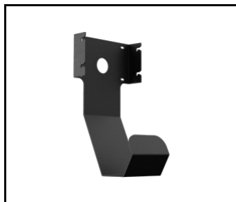
LENERGIZEE wieszak przewodu RAL9005 (424281)